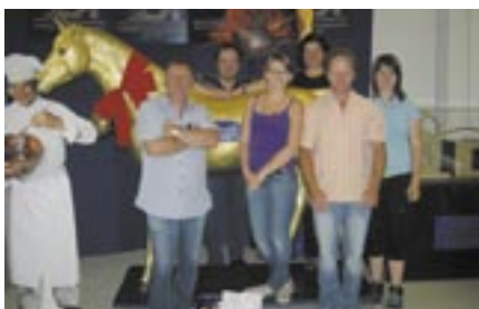
Ausflug im Juli 2009 nach Aachen (waren auch in der Lind Fabrik!)