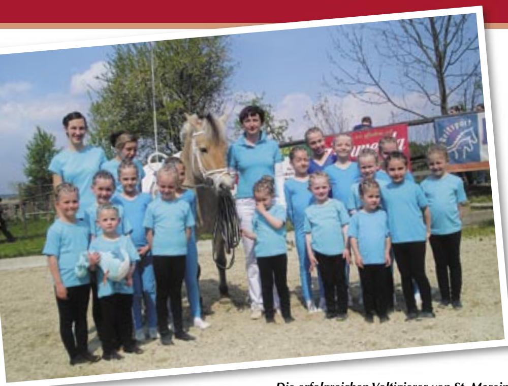
Die erfolgreichen Voltigierer von St. Marein.