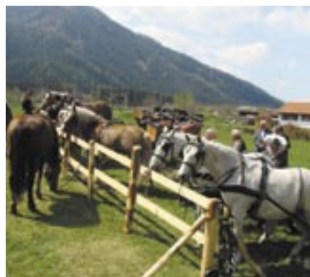
Beim Gasthof Kühberger in der Liesingau wurde die Pferde gesegnet und die Reiter, Fahrer und Zuseher konnten sich Stärken.