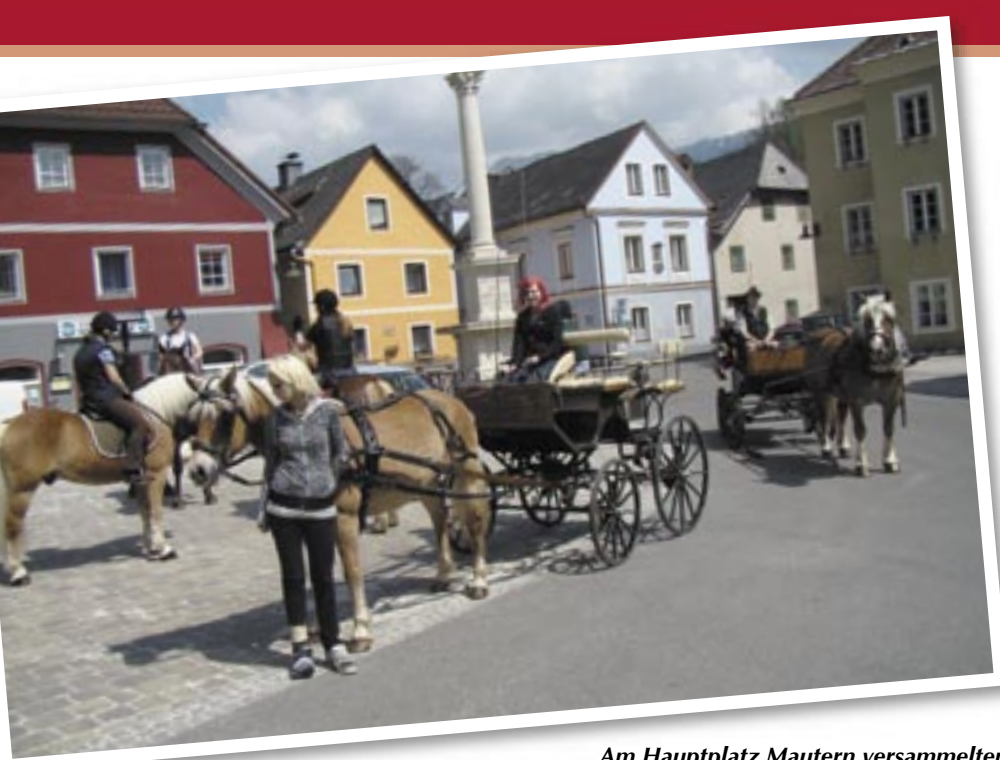
Am Hauptplatz Mautern versammelten sich die Reiter und Gespannfahrer zum Georgiritt/-fahrt.